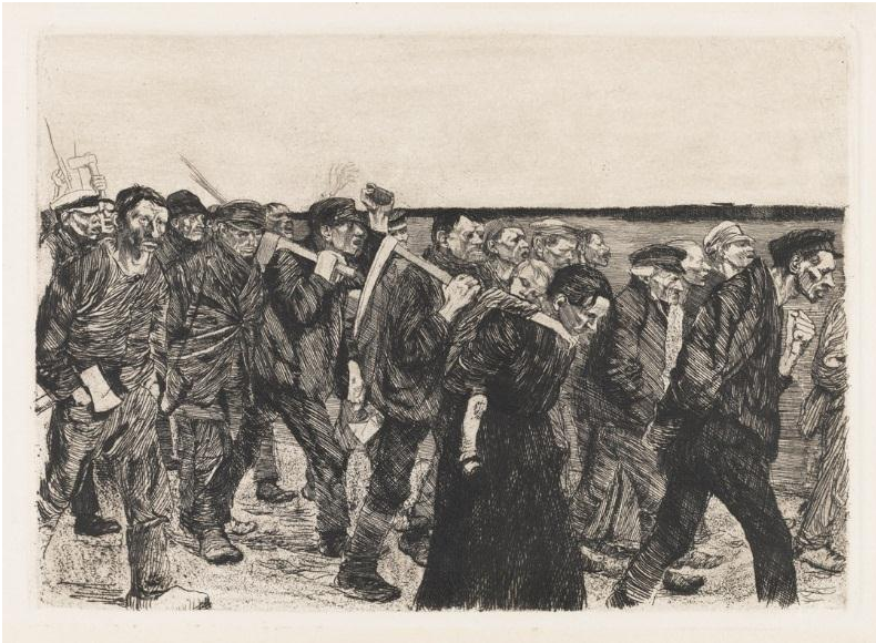
کته کولویتس، راه‌پیمایی بافندگان